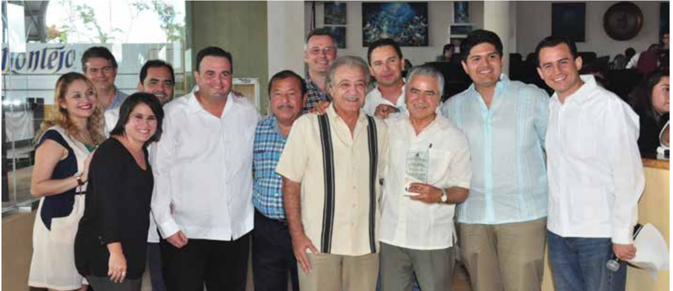
Canirac-Yucatán festejó el Día del Restaurantero